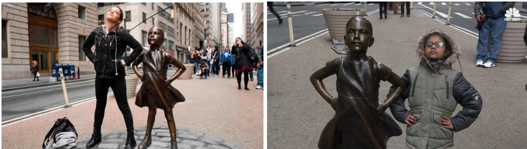
Figura 3 – Pessoas interagindo com a escultura Fearless Girl

Seguindo o raciocínio, as pessoas que tiveram uma experiência estética ao terem contato com a obra, puderam sentir a força da garota enfrentando o touro. Essa jornada estética se dá início pelas experiências passadas e informações que lhe foram conferidas em outro momento cronológico, formando uma combinação que culminará em uma experiência estética.