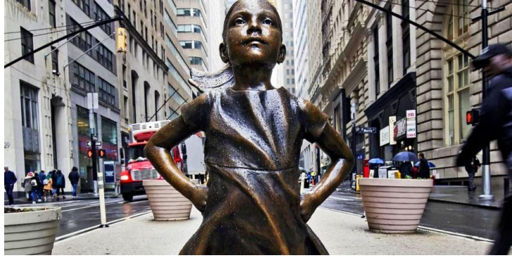
Figura 2 – Escultura de frente Fearless Girl